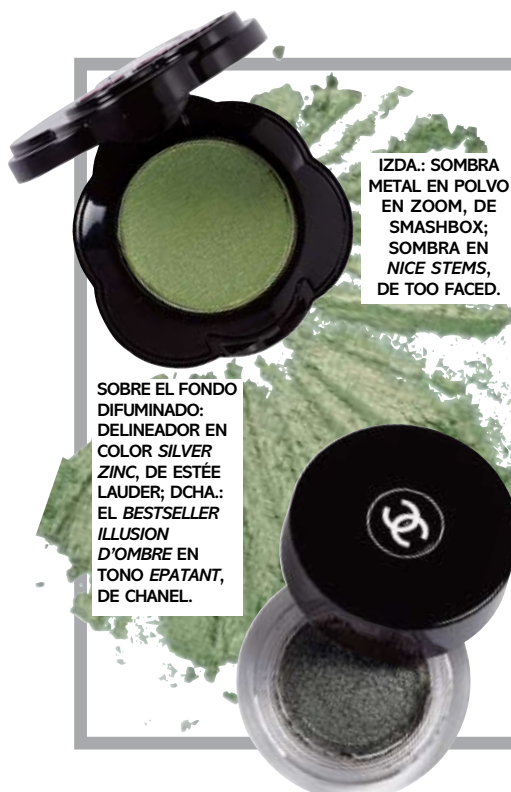
IZDA.: SOMBRA METAL EN POLVO EN ZOOM, DE SMASHBOX; SOMBRA EN NICE STEMS, DE TOO FACED.

CORTESÍA DE ARQUISTE; LUCKY DIGITAL STUDIO; Backstage: LUCA TOMBOLINI/Showbit